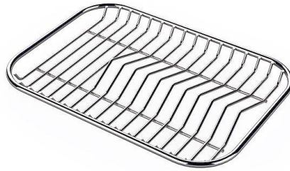
Grille porte-assiettes inox ne peut être utilisé qu'en combinaison avec les accessoires 8644 003 8100 154