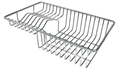
Panier à vaisselle inox 8100 303 * uniquement en combinaison avec l'accessoire 8644 101